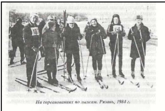
На соревнованиях по лыжам (Рязань, 1984 г.)