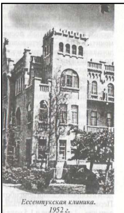
Ессентукская клиника (1952 г.)

Все четыре курорта (Кисловодск, Ессентуки, Пятигорск и Железноводск) уже в начале XX века были соединены железнодорожным полотном - электричкой, поездка в которой давала возможность насладиться панорамой гор и полей. Невольно вспоминались герои лермонтовских произведений и пушкинские стихи.