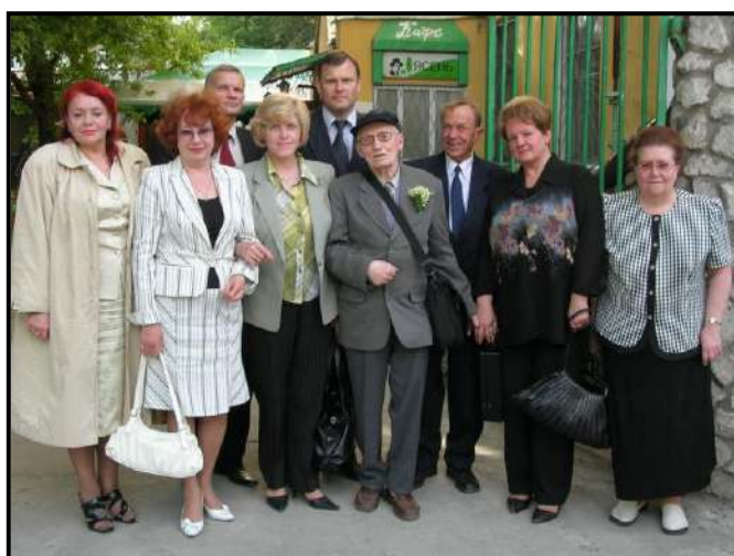
С сотрудниками кафедры при очередном посещении Рязани (2010)

Второй мой брак продолжался около 8 лет и распался после моего отъезда в Германию.