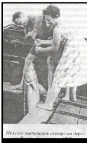
Нелегко вытаскивать осетра на берег из Волги (Астрахань, 1965 г.)

называли лежбищем. Кроме того, купальня с деревянным дном для детей, и без дна, для умеющих плавать, находилась непосредственно на набережной. В летнюю и осеннюю пору поблизости на набережной помещались садки с живой рыбой, в том числе с осетрами, судаками, сазанами, сомами, щуками и другими видами. Говорили, что в былые времена прибывающих в Астрахань удивлял постоянный запах рыбы над городом, но в мою бытность уже никакого запаха рыбы не было. Однако на базарах свежую рыбу можно было купить, за исключением периода запрета, почти всегда. Любимым угощением астраханцев была вобла, которую преподносили друг другу во все сезоны года. Рыбаки располагались на набережной, на мостах, но особенно в известных им местах за городом. В весеннюю пору к леске удочки привязывали по пять крючков и вытягивали ее лишь тогда, когда на всех болтались рыбешки. Я тоже приохотился к рыбной ловле и даже принимал впоследствии участие в соревнованиях, проводимых профкомом института. Меня всегда удивляло, что даже зимой рыба чувствовала, насколько опытен рыбак.