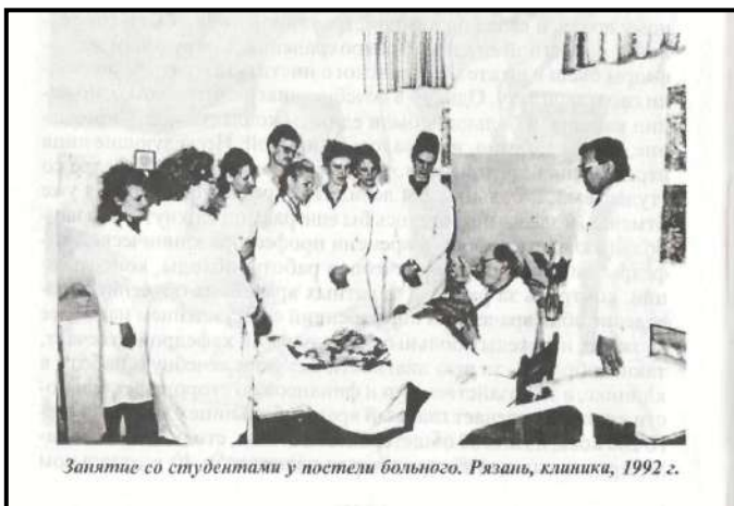
Занятие со студентами у постели больного. Рязань, клиника, 1992 г.