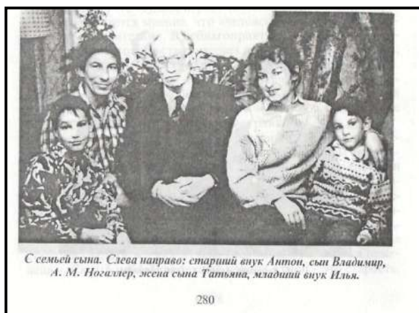
С семьей сына.

Германию они не изменили своим увлечениям.