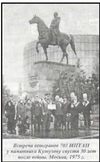
Встреча ветеранов 703 ИПТАП у памятника Кутузову спустя 30 лет после войны. Москва, 1975 г.